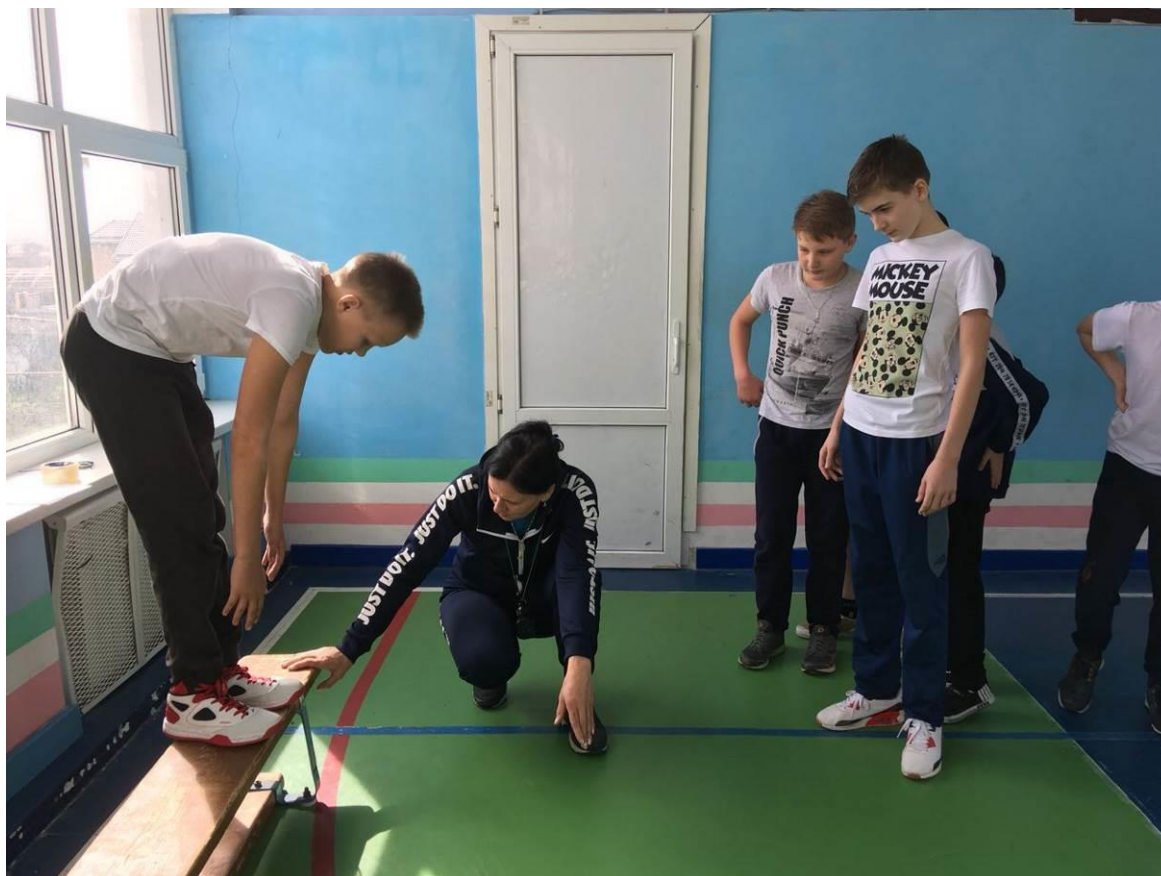
Единый день школьного фестиваля «Готов к труду и обороне!» в 5-7 класса