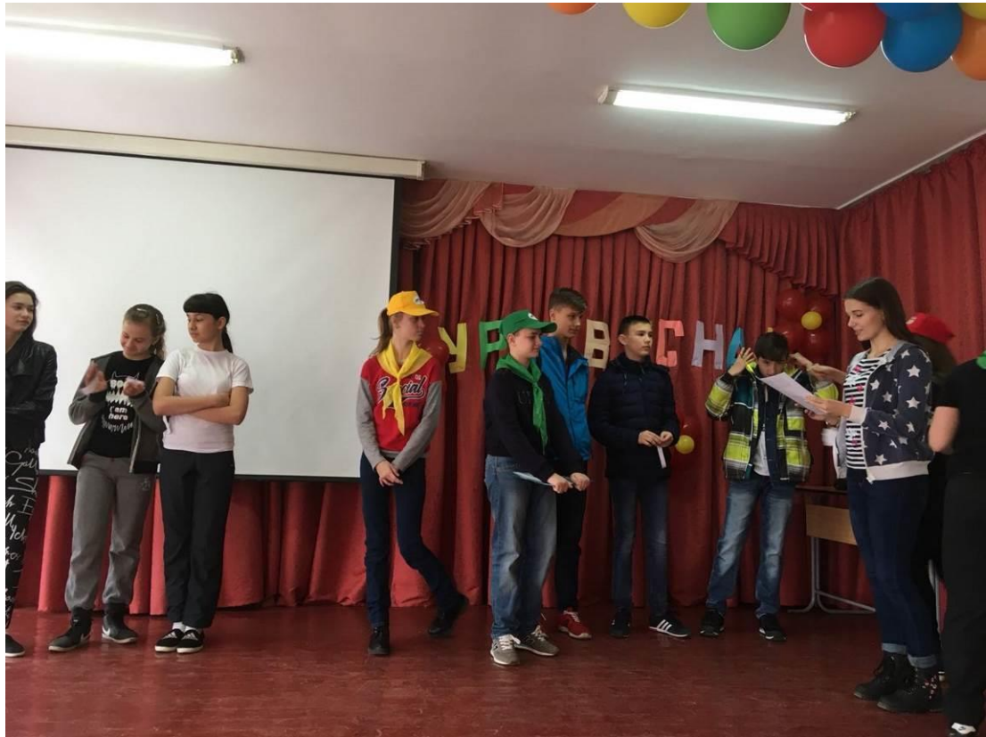
Единый день здоровья для учащихся 5-6 классов