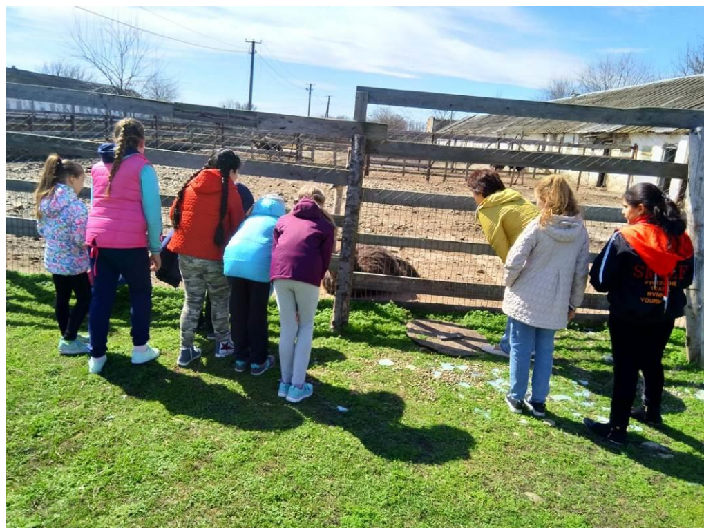
Весенние поездки на каникулах