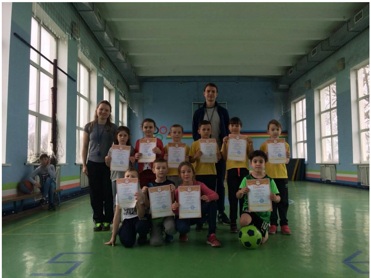
День массового футбола «Ближе к звездам!» для 1-2, 3-4 классов