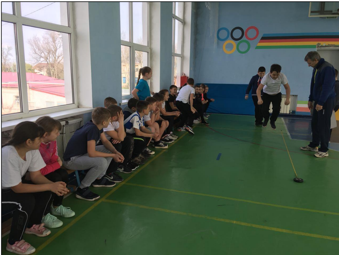
Единый день школьного фестиваля «Готов к труду и обороне!» в 5-7 класса