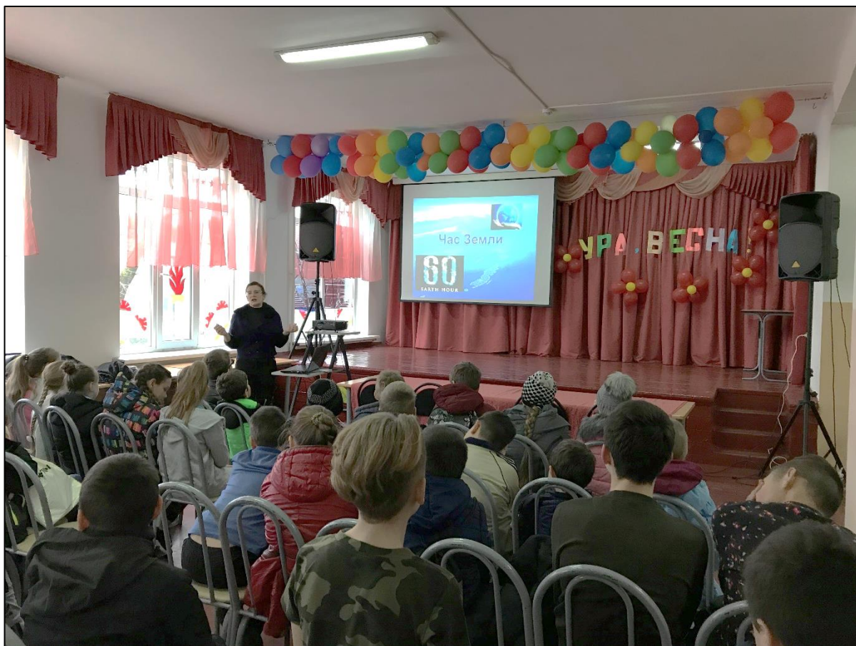
Мероприятие «День защиты Земли» для учащихся школы