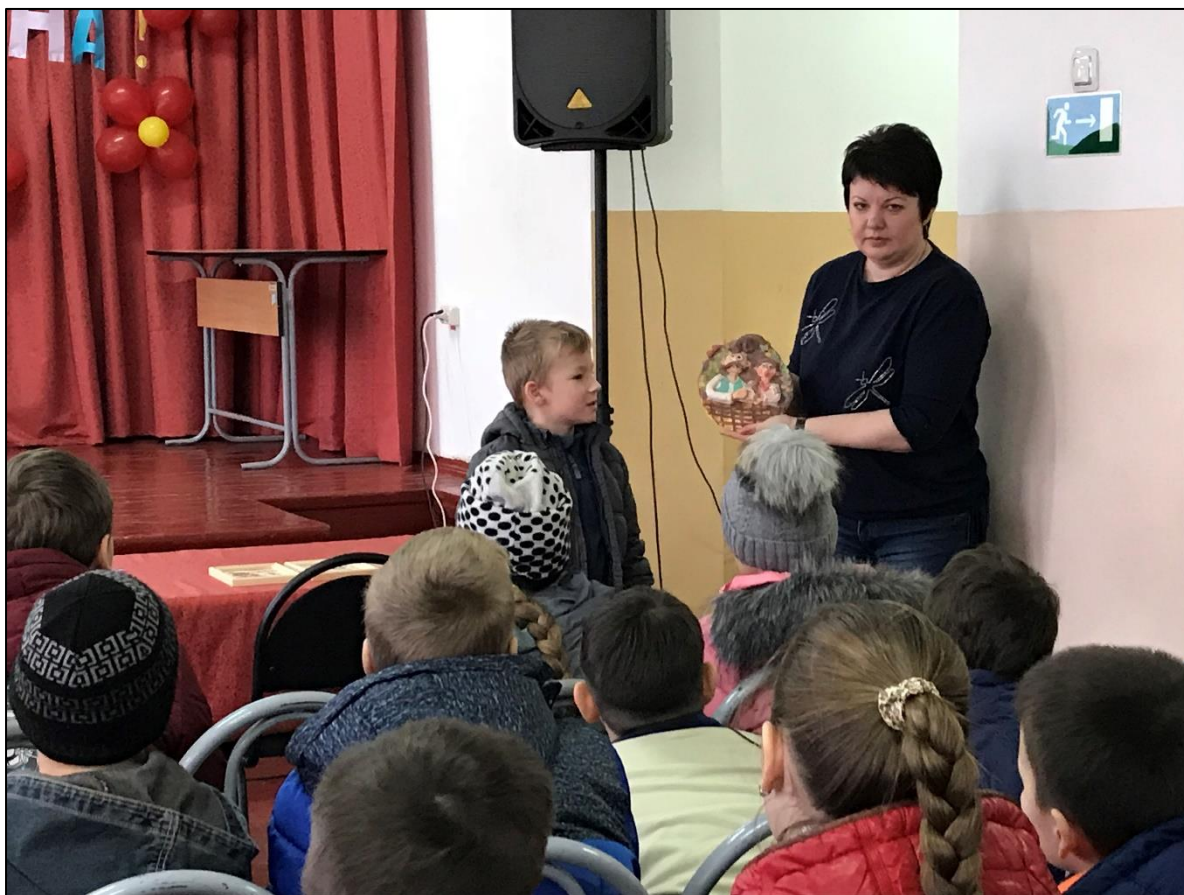
День творчества и изобретений для учащихся 1-2, 3-4 классов